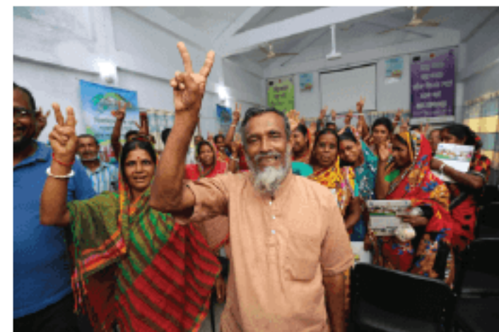
Villagers are expressing their happiness after resolving a case through Village Courts

Sources of LGRD and UNDP office stated that, the village courts would also empower local people, especially women and vulnerable people.