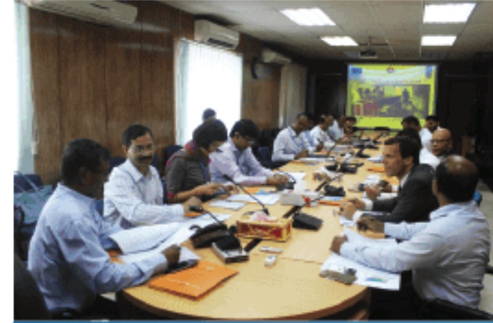
Participants of the Project Steering Committee share their recommendations to push the AVCB II Project forward with policy guidance and facilitating inter-ministerial coordination