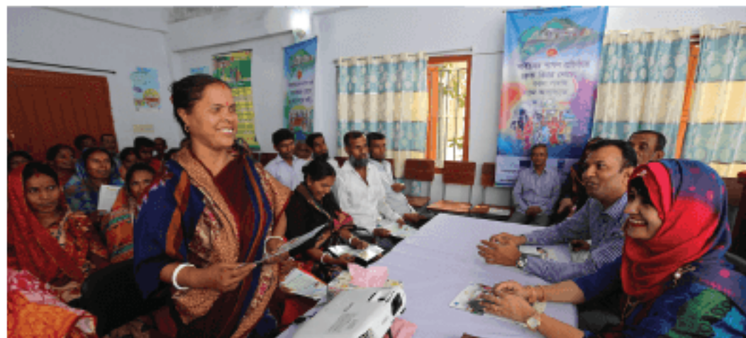
Awareness building on Village Court among women is a regular activity of the project

The chief guest laid emphasis on further strengthening the village courts to reach justice to the poor by resolving minor disputes and conflicts amicably through proper implementation of the project to attain the suitable development goals by 2030.