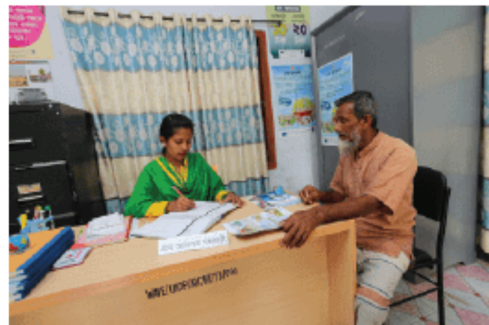
Registering a case in a Village Court is very easy for its service seekers

If cases were diverted from the district courts quickly enough, it would reduce the burden on the formal judiciary system and the law enforcement agencies, and ensure that the rural poor can gain access to legal remedies. The rationale for guiding the required policy reforms is also supported by our cost-benefit analysis.