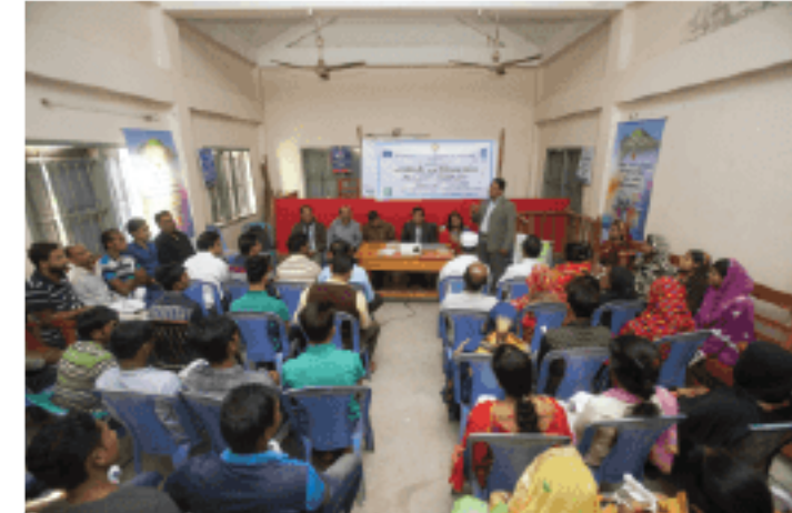
Participants of a community sharing meeting at union level express their interest and commitments to make village courts functional with their active involvement at various levels